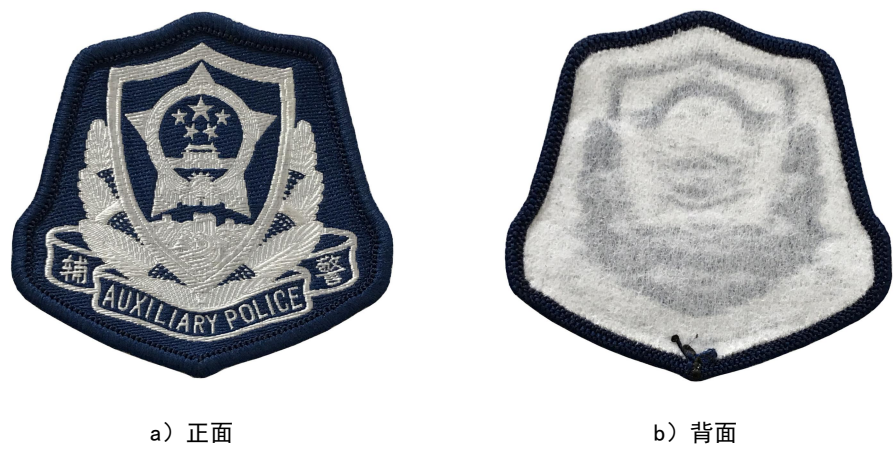
图 1 丝织帽徽样式结构

4.4.2 丝织帽徽颜色应符合标样；批产品颜色与标样相比，色差不低于 4-5 级。